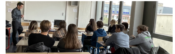
Rencontre élèves-dirigeants - Novembre 2022